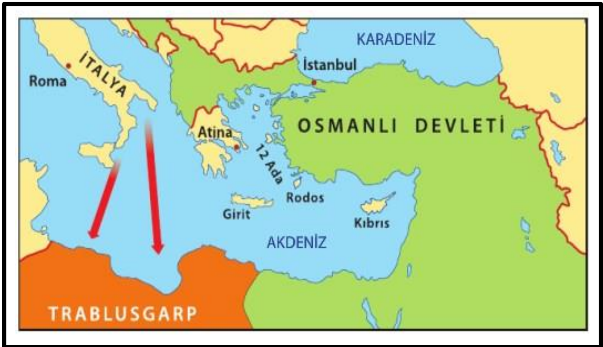
Trablusgarp Savaşı Sonunda Osmanlı sınırları

NOT: Uşi Antlaşması ile Osmanlı Devleti Kuzey Afrika'daki son toprak parçası olan Trablusgarp'ı (Libya) kaybetmiş oldu. Ege'deki Türk egemenliği sarsıldı. Trablusgarp Savaşı, Mustafa Kemal'in sömürgeciliğe karşı ilk savaşıdır.